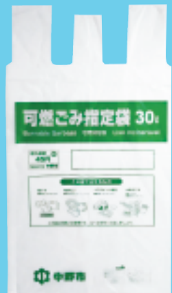
現在の可燃ごみ指定袋